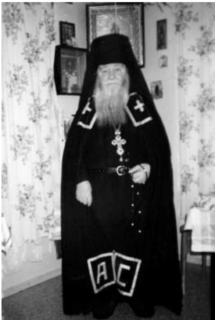
Архимандрит Спиридон (Комаров), ок. 2000 г.