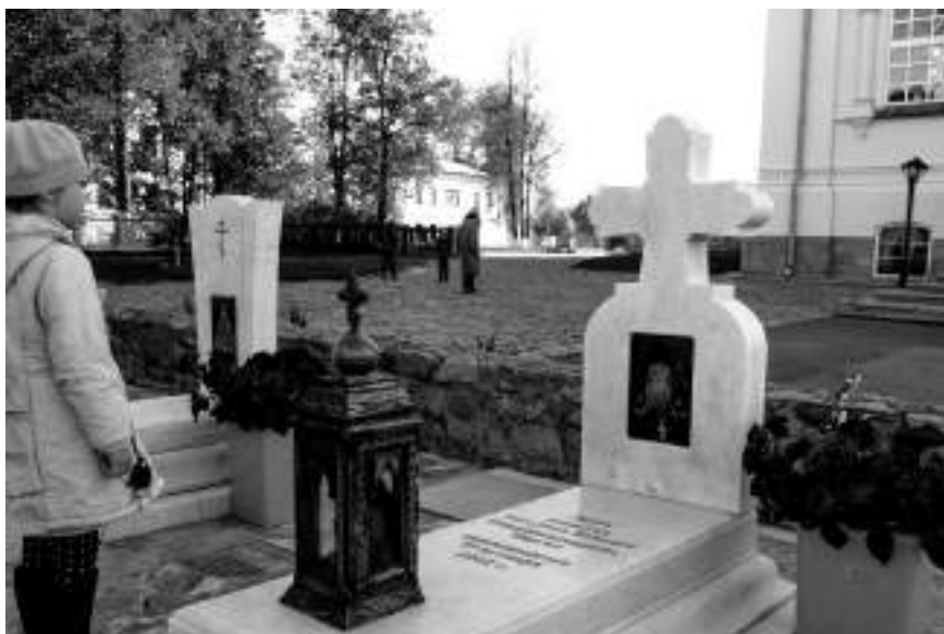
Могила отца Спиридона – схирхимандрита Сергия (Комарова) у алтаря Преображенского храма, 2019 г.