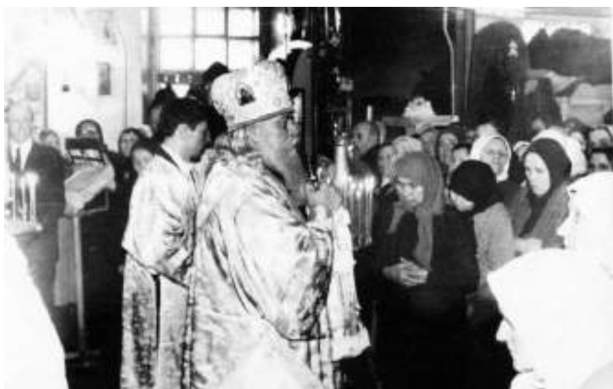
Приезд архиепископа Климента в Карпинск, 1968 г.