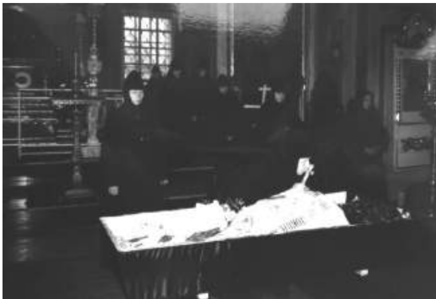
Гроб с телом батюшки в Преображенской церкви Верхотурского мужского монастыря. Попрощаться с отцом Сергием пришли насельницы Покровского женского монастыря г. Верхотурья, октябрь 2002 г.