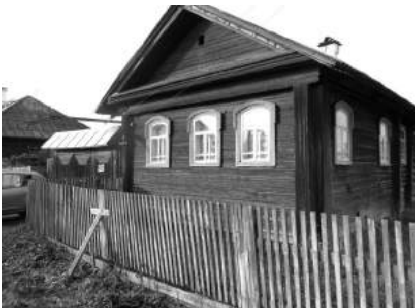
Дом отца Спиридона на Красноармейской улице, 2013 г.

В том же 1990 году батюшка – кто тогда знал, что монастыри откроются - купил дом на Красноармейской улице, поближе к церкви. До него в доме жили две монахини, которые, лет пять или больше, стряпали там просфоры. Дом был старый, ремонтировали его два года. Пол перестилали, шифер меняли, потолок, стены – все делали нанятые люди. Ограда была крытая, но батюшка решил двор не закрывать, чтобы в окно свет попадал, солнце светило.