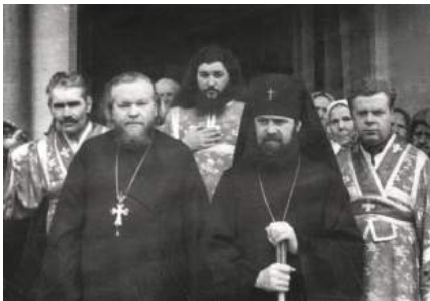
В то же посещение владыкой Платоном Свердловской епархии протоиерей Владимир Ведерников и архиепископ Платон на крыльце Казанской церкви г. Карпинска, сентябрь 1982 г.