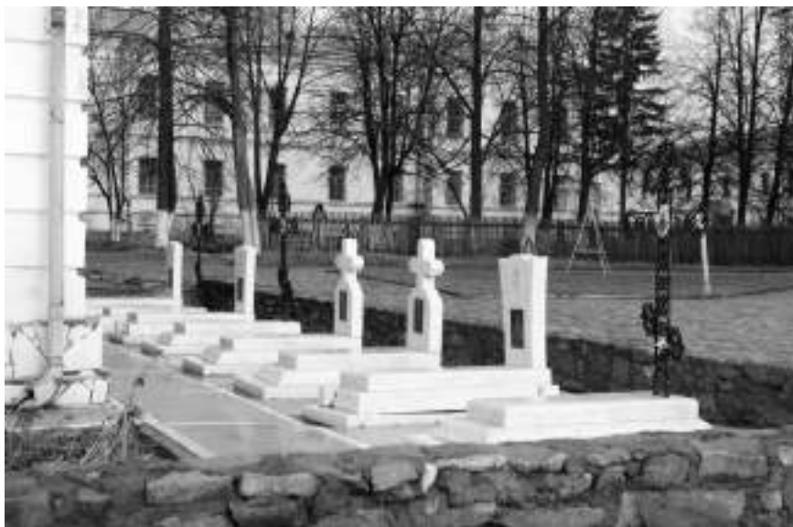
Монастырское кладбище у алтаря Преображенского храма Верхотурского мужского монастыря, 2014 г.