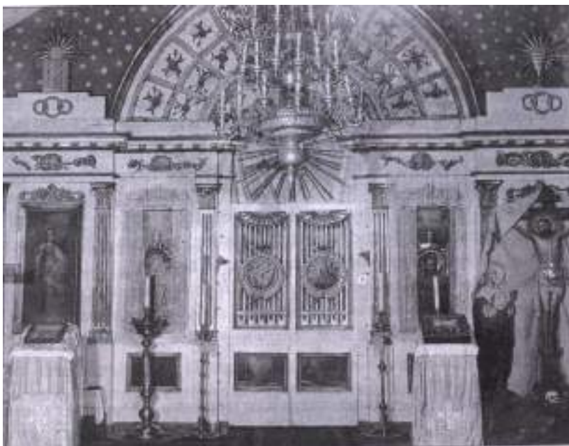
Иконостас Казанской церкви, 1970-е годы.